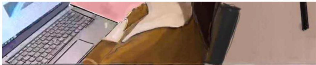
图2 副机位（侧面）示意图

2. 信号良好、稳定的网络，能满足网络远程复试要求。建议使用宽带网络+移动网络的组合方式，若其中一种网络出现断网等故障时，可及时切换另一种网络连接。